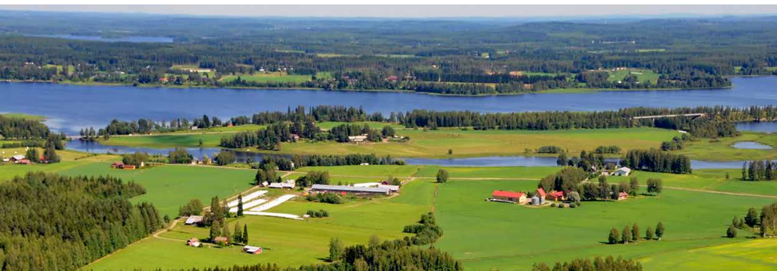
Tavinsalmea, keskellä Hussolansaari kahden sillan välissä.

Tosin kyseisellä usean sadan vuoden aikana paikalla on myllätty niin paljon, ettei ainakaan tähänastisissa tutkimuksissa sieltä ole