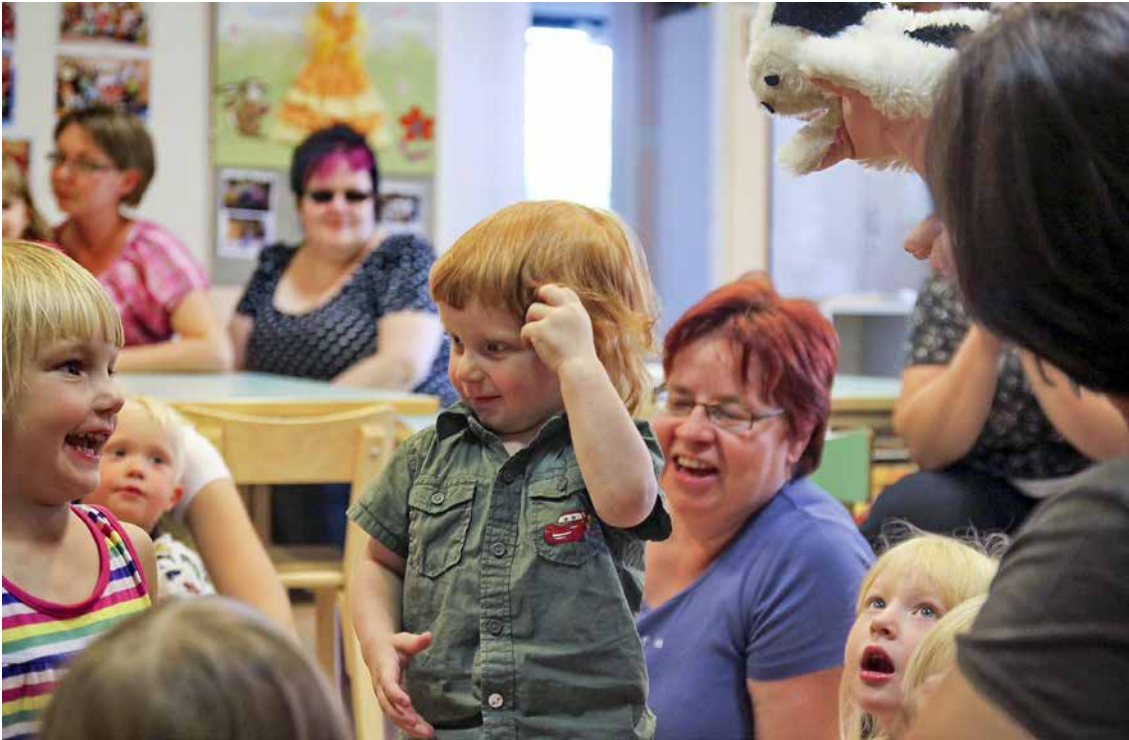
Päiväkoti Mesikan 30-vuotisjuhlista vuonna 2011 oli kaikilla hauskaa, niin kuin asiaan kuuluu.

ta kustannuksista vastaa kunta. Päivähoitopaikkojen tarve kasvoi: Vuonna 1988 jäi 11 lasta päivähoidon ulkopuolelle ja perhepäivähoitajien saaminen oli hankalaa.