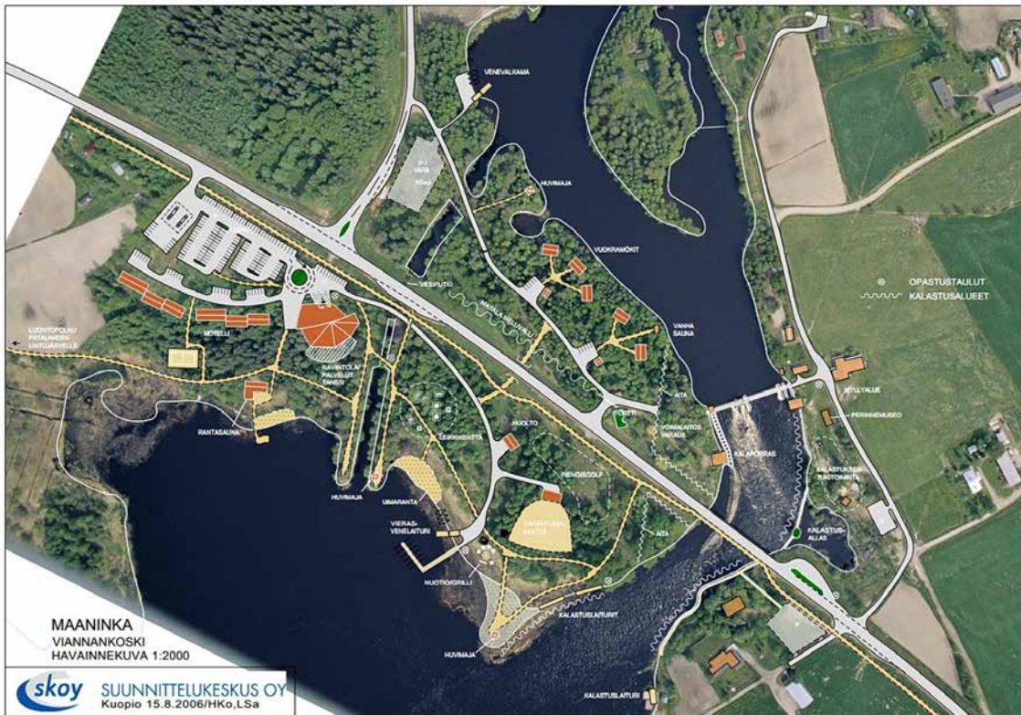
Havainnekuva Viannankoskelle kaavallusta matkailualueesta; motelli, uimaranta, rantasauna, pienoisgolfrata ja vuokramökkit olisivat suunnitelman mukaan elävöittäneet perinteistä rikkaan koskialueen uudelle vuosituhannele.

Tuovilanlahden ja kirkonkylän matkustajakodit toki majoittivat matkajia 1930-60-luvuilla, mutta niiden lopetettua seuraaja Maaningan Helmi aloitti vasta 2008 kirkonkylällä.