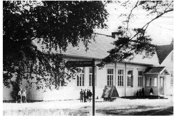
Kinnulanlahden vanha koulu.