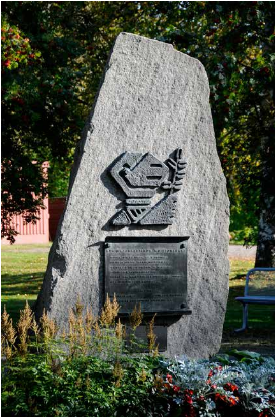
Kuninkaankartanon muistomerkki siirrettiin nykyiselle paikalleen Maaningan kunnantalon puistikkoon hallintopitäjän 450-vuotisjuhlapäivänä 19.7.1997.