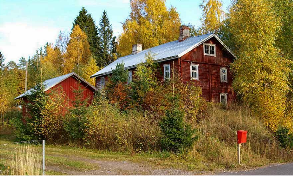
Sirkkaborg autoituneena vuonna 2008.