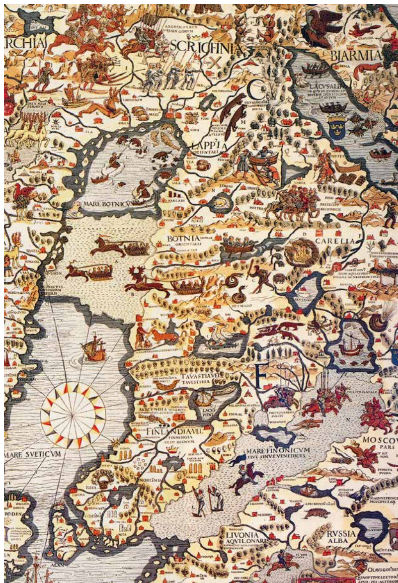
Olaus Magnuksen laatima kartta, Carta Marina et Descriptio Septentrionalium Terrarum kuvasi Suomea hyvinkin kauniisti 1500-luvun alkupuolella.

muille koko käräjärahaan nähden. Varsinainen surmaaja pääsi kuitenkin pakoon.