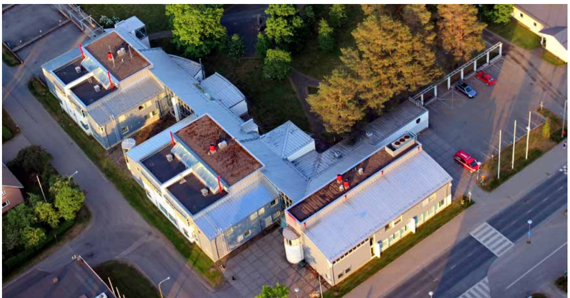
Maaningan uuden kunnantalon pienoismalli, ja sama kohde täysmittakaavassa.

tettiin. Muina säästämistoimina keskusteltiin asukasluvuun nähden ylisuuren koulupiiverkon supistamisesta ja kolmen koulun lakkautuksesta. Vianta, Kurolanlahti, Haapamäki ja Tavinsalmi lakkautettiin parin vuoden sisällä.