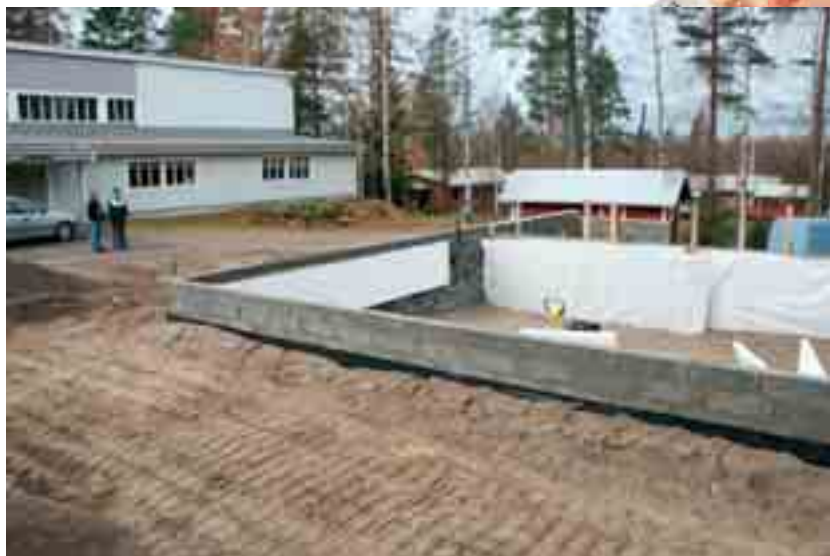
Alapitkä kehittyi riuskojen kyläläisten tarmolla. Osaksi talkoilla ollaan rakentamassa nuorisoseurantalonsa uudisrakennusosaa, joka valmistuu syksyllä 2010.

Kun alapitkäläiset nuoret perustavat perheen, asettuvat he usein asumaan