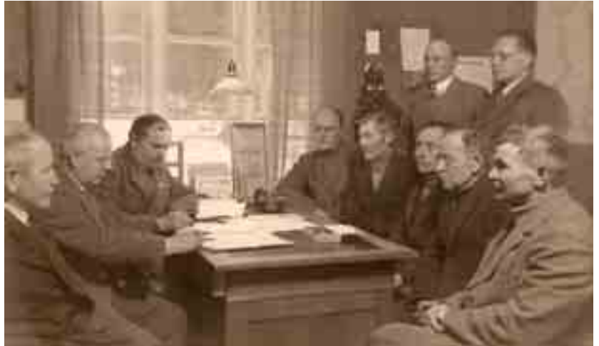
Ensimmäisiä osuuskuntakokouksia Alapitkän Osuuskassassa.